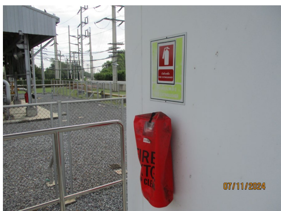
ภาพที่ 2-4 เครื่องดับเพลิงแบบเคมีผง