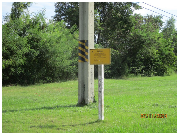
ภาพที่ 2-1 ป้ายแสดงตำแหน่งแนวท่อส่งก๊าซธรรมชาติ