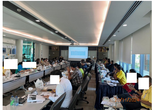
วันที่ 20 พฤศจิกายน พ.ศ. 2567