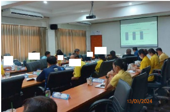
วันที่ 13 กันยายน พ.ศ. 2567