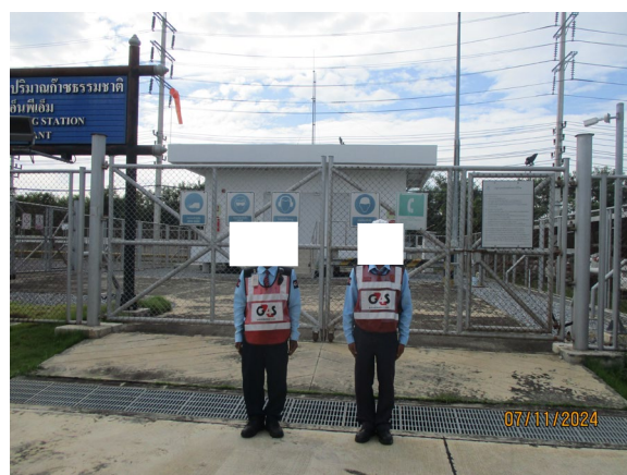
ภาพที่ 2-5 เจ้าหน้าที่รักษาความปลอดภัย บริเวณสถานี วัดและควบคุมแรงดันก๊าซ (MRS)