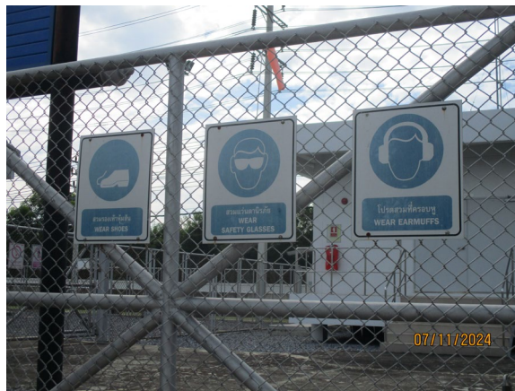
ภาพที่ 2-7 ป้ายเตือนให้สวมใส่อุปกรณ์คุ้มครองความปลอดภัยส่วนบุคคล