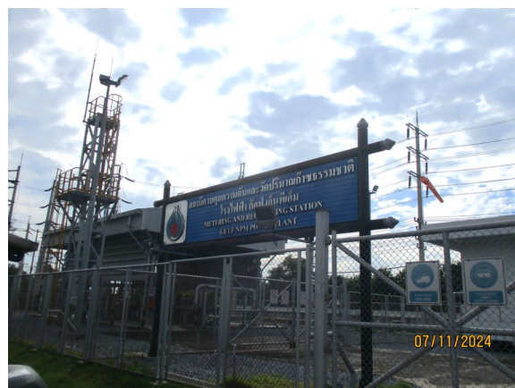
ภาพที่ 2-3 สถานีวัดและควบคุมแรงดันก๊าซ (MRS)