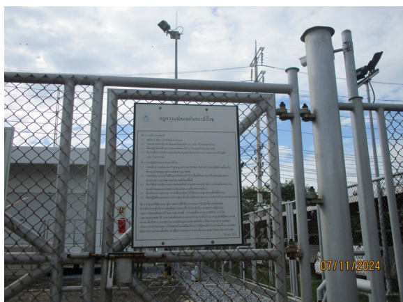
ภาพที่ 2-2 ป้ายแสดงกฎความปลอดภัยสถานีก๊าซ